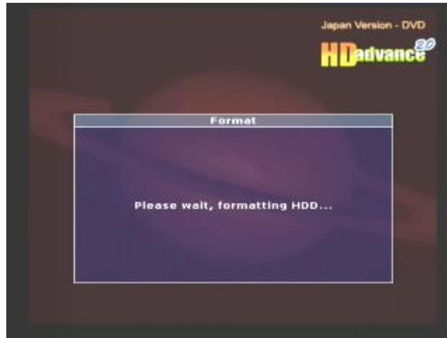
フォーマット中です